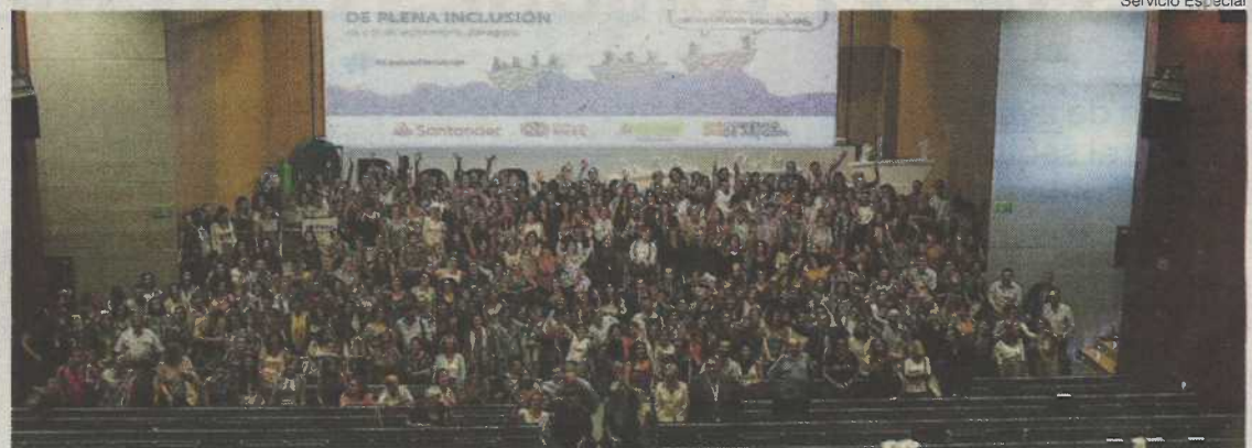
► Encuentro estatal de Plena inclusión, en Zaragoza, antes del covid.

Este plan duró del año 2016 al 2020 y afectó a las 935 entidades de Plena inclusión.